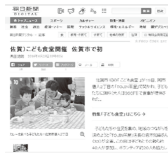
こども食堂