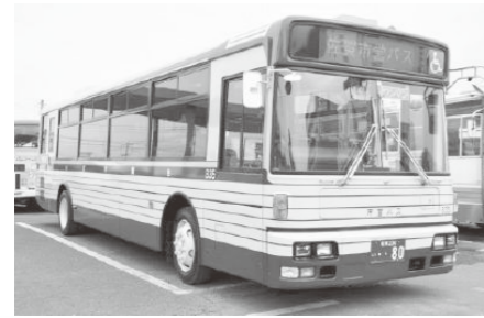
復刻カラーバスも提案しました!!